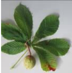
La feuille du marronnier et une bogue fermée.

Nous les avons ensuite observées, dessinées dans la classe.